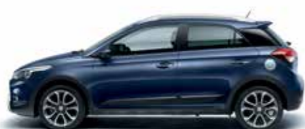
Morning Blue alapszín