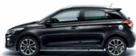
Phantom Black gyöngyház