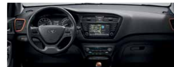
Fekete - narancssárga beltéri színcsomag (Komfort felszereltségtől)