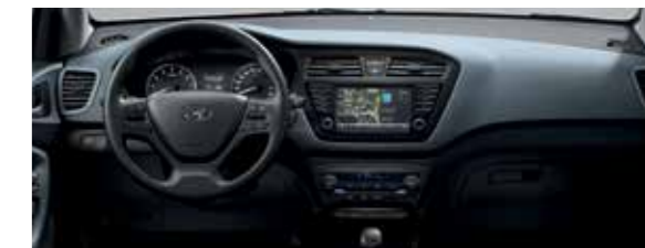
Szürkéskék beltéri színcsomag