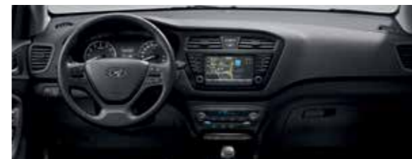
Komfort szürke beltéri színcsomag