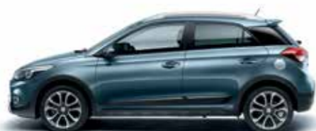
Aqua Sparkling metálszín