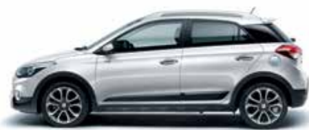
Polar White alapszín

Nincs két egyforma ember, mindenkinek egyéni elvárásai és eltérő preferenciái vannak. Az i20 Active gazdag karosszériaszín-választékának árnyalatai egytől egyig kiemelik a modell kalandvágyó természetét. Összesen négyféle belső színvilág közül választhat, valamint egy különleges opciót is kínálunk, amely Tangerine narancsszínű dekorbetétekkel gazdagítja a belső teret. Az opciós felszerelések és tartozékok kínálatából tökéletesen saját ízléséhez igazíthatja autóját. Helyi Hyundai márkakereskedője örömmel segít Önnek az igényeinek leginkább megfelelő tételek kiválasztásában.