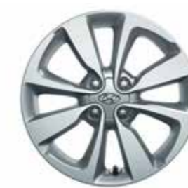
16 colos könnyűfém keréktárcsák