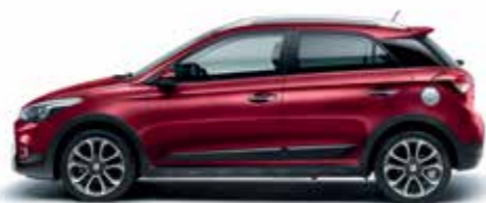
Red Passion gyöngyház