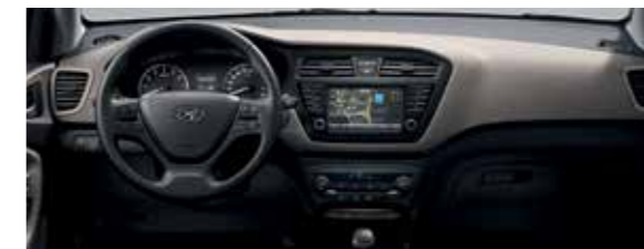
Elegáns bézs beltéri színcsomag