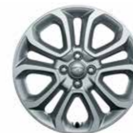
17 colos könnyűfém keréktárcsák