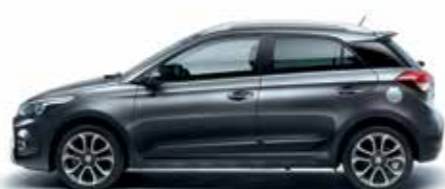
Star Dust metálszín