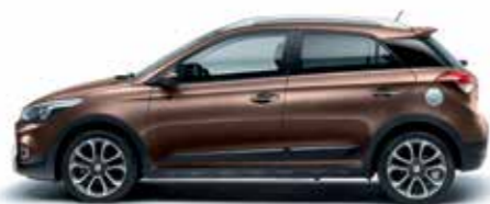
Cashmere Brown metálszín