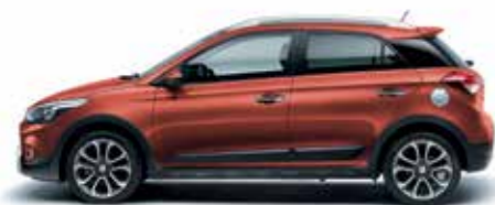
Tangerine Orange metálszín