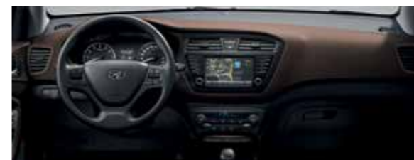
Barna beltéri színcsomag