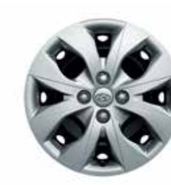
15 colos acél keréktárcsák