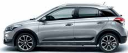
Sleek Silver metálszín