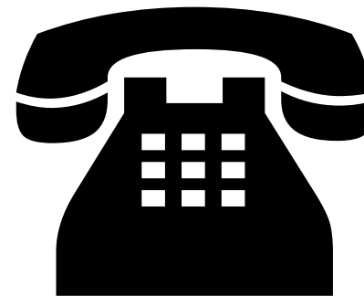
D. Információs szolgálat