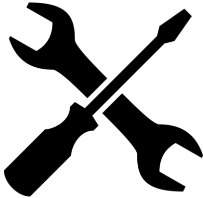
A. Helyszíni javítás