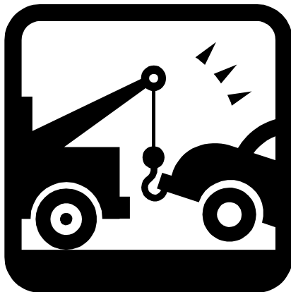
B. Gépkocsi szállítás/vontatás a legközelebbi Hyundai haszongépjármű márkaszervizig